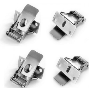
Klips z linką